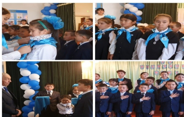
«Жас Ұлан» балалар ұйымының қатарына қабылдау