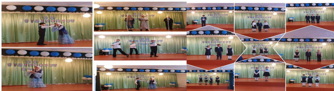
25 қазан Республика күніне орай «Мәңгілік ел-Қазақстан» тақырыбында мерекелік концерт