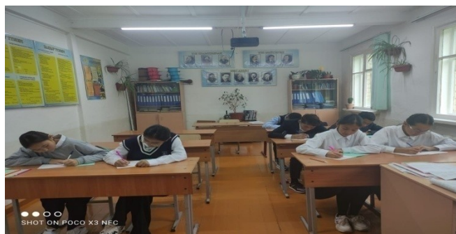
«Ұлы даланың ұлы есімдері» эссе байқауы