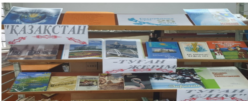
«Қазақстан-туған жерім, туған елім» көрме